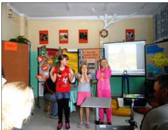
Dobrze jest poćwiczyć