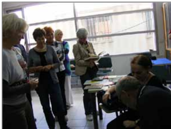
Spotkanie z Aloną Frankel – ocalonym dzieckiem i pisarką

Podczas zajęć warsztatowych zostały zaprezentowane materiały edukacyjne Instytutu Yad Vashem oraz możliwości ich wykorzystania. Polscy nauczyciele opracowali scenariusze zajęć, z zastosowaniem tych materiałów. Warto podkreślić, że każdy z uczestników seminarium został wyposażony w duży pakiet wybranych przez siebie materiałów, które po powrocie może wykorzystywać w swojej codziennej pracy.