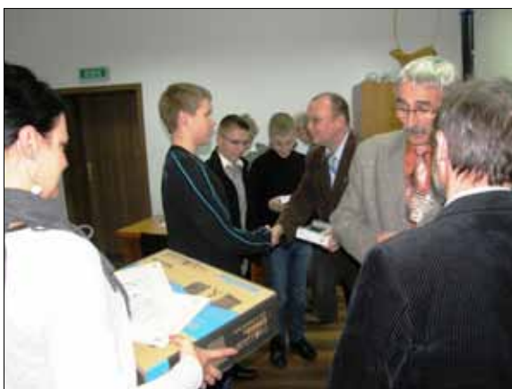
Zwycięska drużyna Gimnazjum nr 11 odbiera wyróżnienia