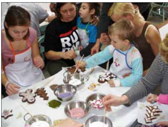
Fot. 1. Przedświąteczne strojenie pierników