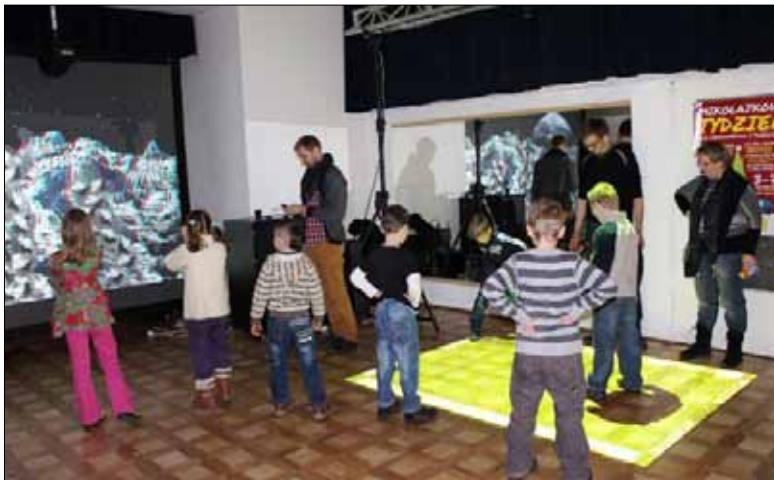
Warsztat Mikołajki w 3D