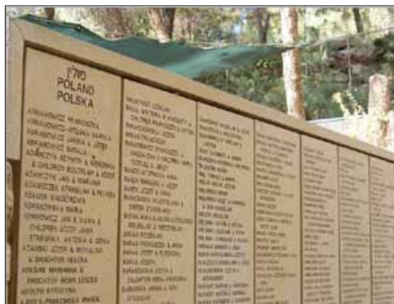
Kiedy na terenie Instytutu YadVashem zabrakło miejsca na sadzenie drzewek Sprawiedliwych Wśród Narodów, powstał ogród, gdzie na tablicach zapisywane są nazwiska kolejnych osób, które bezinteresownie ratowały Żydów.

Program wizyty obejmował także zwiedzanie Muzeum Zagłady i innych obiektów na terenie Instytutu Yad Vashem, m.in. Muzeum Sztuki, Centrum Multimedialnym, Centrum Edukacyjnym, archiwum. Zwiedzaliśmy również teren, gdzie odnajdywaliśmy drzewka Sprawiedliwych Wśród Narodów, pochodzących z naszego województwa. Mogliśmy poznać, jak funkcjonuje Instytut, jakie realizuje zadania jako placówka badawcza i edukacyjna.