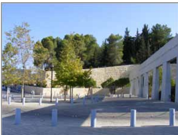
Instytut Yad Vashem – brama wejściowa

Kujawsko-Pomorskie Centrum Edukacji Nauczycieli w Toruniu było organizatorem seminarium dla nauczycieli woj. kujawsko-pomorskiego w Instytucie Yad Vashem w Izraelu.