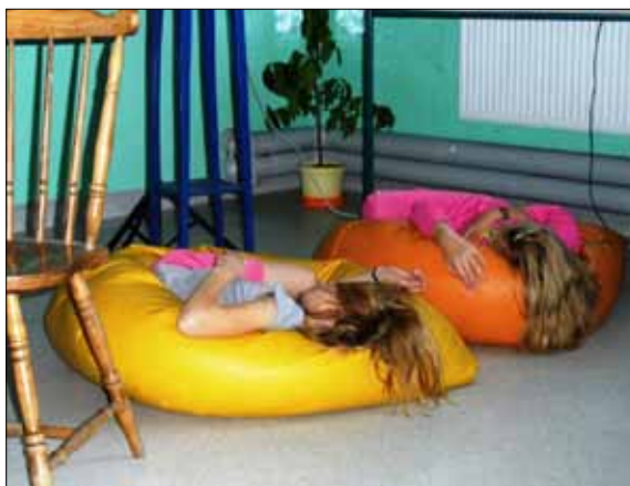
Sen to zdrowie

Tata: Tak?! Obejrzyjcie ten filmik, a przejdzie ci ochota na takie jedzenie.