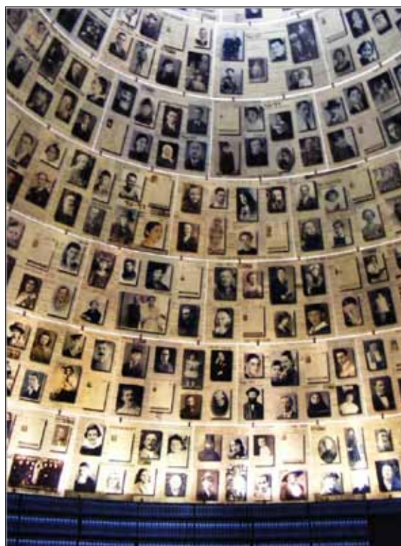
Sala Imion w Muzeum Zagłady – tu zgromadzono zdjęcia i dokumenty 4,5 mln. spośród 6 mln. zamordowanych podczas Zagłady Żydów. Pracownicy Instytutu robią wszystko, aby zidentyfikować z imienia i nazwiska każdą ofiarę.

Udział w seminarium to niepowtarzalne doświadczenie, które uświadomiło nam, uczestnikom, jak ważne jest zachowanie pamięci tego bezprecedensowego w dziejach ludzkości zdarzenia, jakim była Zagłada Żydów, po to, aby nigdy więcej się nie powtórzyło. Świadomość roli i odpowiedzialności nauczycieli będzie dla nas nieustającym impulsem do podejmowania działań służących kształtowaniu postawy tolerancji, a wiedza, doświadczenie i materiały otrzymane podczas seminarium są dla nas ogromnym wsparciem i z pewnością zostaną wykorzystane. ■