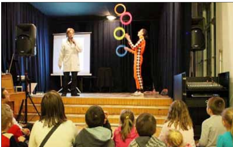
Warsztat Ale Cyrk