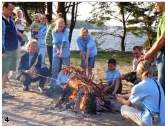
Fot. 5. Wycieczka uczniów do Krakowa