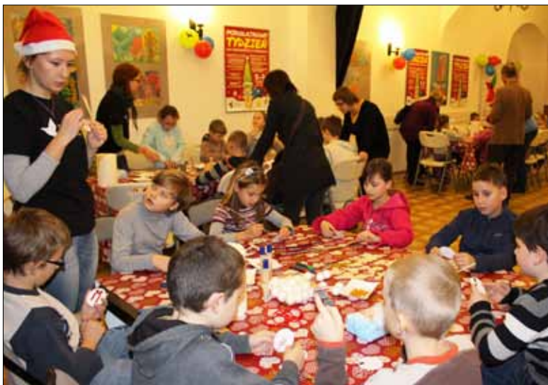
Warsztat Naukowe Mikołajki