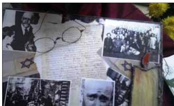
Zdjęcia poświęcone Januszowi Korczakowi jako wprowadzenie do zorganizowanej wystawy prac malarstwa i witrażu Janusz Korczak Król dzieci podopiecznych Fundacji Arkadia

życia Patrona naszej Szkoły. Po pierwsze ważne jest niesamowicie wzmacniające ocenianie i motywowanie naszych uczniów, często zmagających się z wieloma różnymi trudnościami, także natury materialnej, ale i emocjonalnego ubóstwa. Po drugie trzeba zrobić wszystko, aby nie trzeba było już wybierać przedstawień szkolnych mających przygotować czy oswoić dzieci z tematem umierania. Po trzecie, by sztuki typu Pocztą Tagore nie realizowały się w rzeczywistości masowej skali.