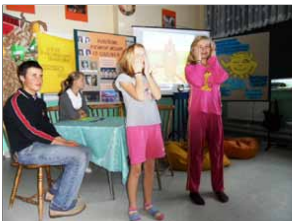
Rano trzeba się umyć